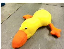
oder kuschelige Stoffenten...