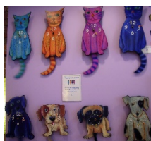
oder Uhren mit verschiedenen Motiven.

In der Textilverarbeitung geht es natürlich auch um die Reparatur und Pflege von Textilien und wir nähen mit der Nähmaschine z. B.