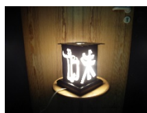
oder eine Japanlampe